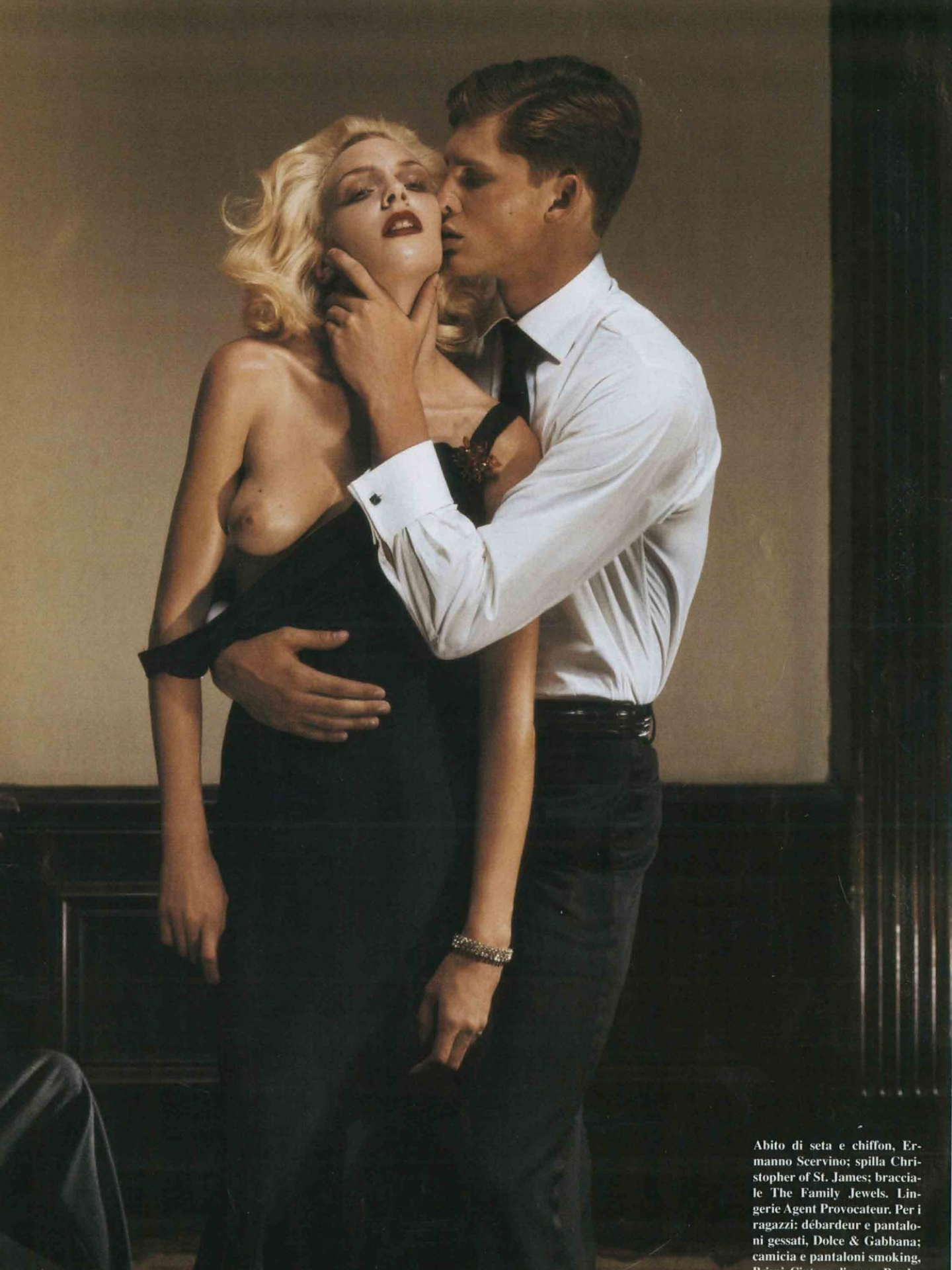
Abito di seta e chiffon, Ermanno Scervino; spilla Christopher of St. James; bracciale The Family Jewels. Lingerie Agent Provocateur. Per i ragazzi: débardeur e pantaloni gessati, Dolce & Gabbana; camicia e pantaloni smoking, Prada.